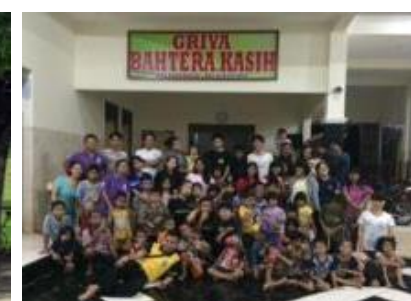
トビタテ留学JAPANでインドネシア