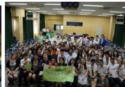
アメリカ高校生と交流