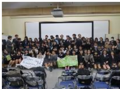
韓国高校生と交流