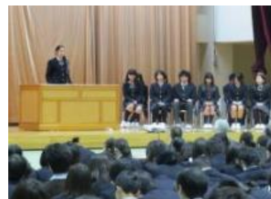
スピーチコンテスト