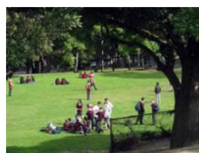
姉妹校 フォートストリート高校を訪問