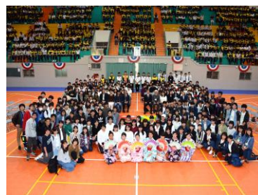
海外修学旅行台湾