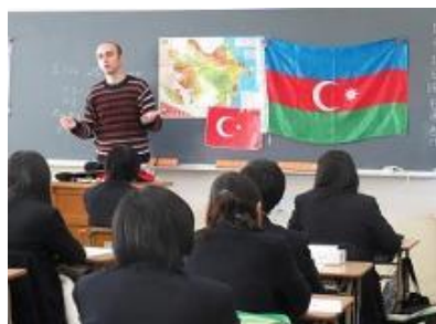
留学生が先生プログラム