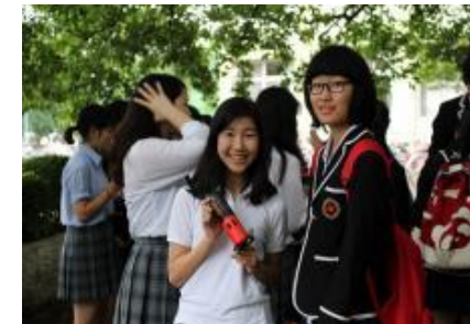
中国高校生と交流