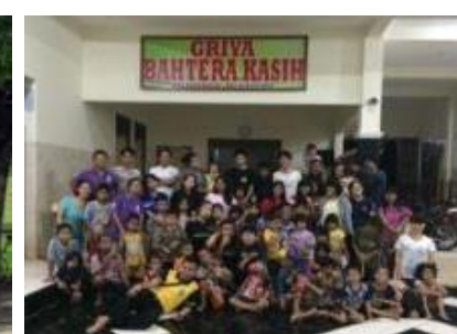
トピタテ留学JAPANでインドネシア