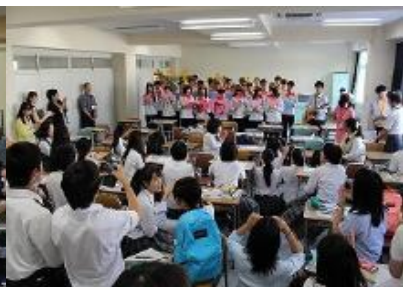
台湾高校生と交流